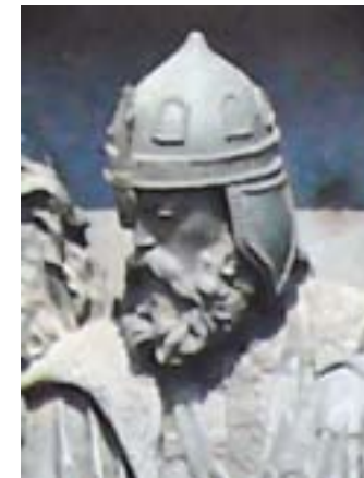
Князь Василий (Константин) Острожский (2 февраля 1526 – 24 февраля 1608)

В 1606 г. в созданной им типографии в Сятине еп.Гедзон Балабан печатно издал «Требникъ». В его предисловии еп. Гедзон рассказывает, как патриарх Константинопольский Мелетий помог ему в ответ на просьбу предоставить верные тексты «Требника» и «Служебника» для печати на славянском языке. «...не презрѣвъ моленія моего, но посла ми служебникъ, и сію книгу Требникъ добръ исправленъ по древнѣи (Святыя горы требникъъ). Егоже и роукою своею подписавъ събл(а)го(с)ло(в)енъиъ пастырскимъ повелѣвая въ общую ползу великому русскому роду избразити.» (РИБ. Т.19. Птб. 1903. Примѣчанія. с.18).