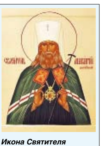
Икона Святыя Макария (Невского).

В с. Кольонском после вечерняго богослужения Владыка беседовал с взрослыми о совершенном Иисусом Христом деле человеческого спасения. Начатая с вечера беседа была продолжена и закончена уже назавтра после литургии. Вслед за этим особо были испытаны самим Владыкою ученики Кольонских школ: церковно-приходской двухклассной (учащихся 45 чел.) и министерской (учащихся 70). Посетив проживающих здесь крестьянского начальника и ... пристава. Владыка отбыл из