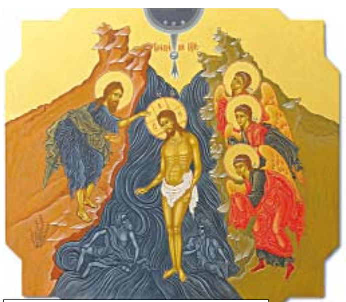
19 января – СВЯТОЕ БОГОЯВЛЕНИЕ. КРЕЩЕНИЕ ГОСПОДА БОГА И СПАСА НАШЕГО ИСУСА ХРИСТА.