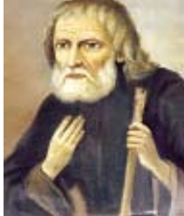
11 января – преподобный Василиск Сибирский

Отбывать наказание отец Леонид был направлен в Мариинское отделение Сиблага НКВД, где скончался 10 января 1938 года.